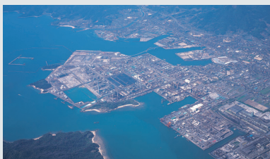
東ソー株式会社 南陽事業所